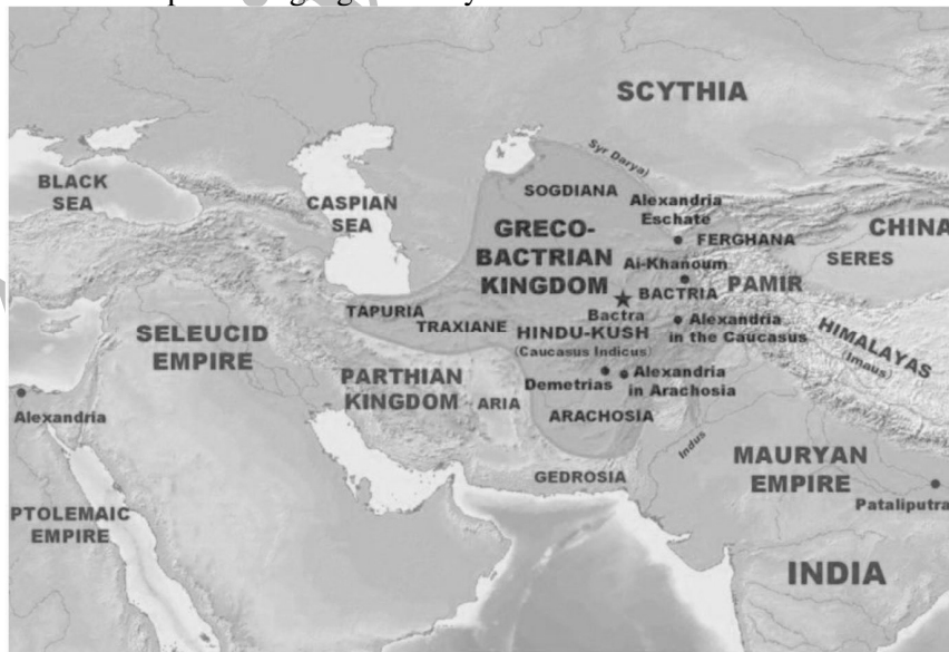
تصویر ۲: نقشه موقعیت امپراطوری بلخ

http://www.geugo.l.u-tokyo.ac.JP/hkum/bactrian.html