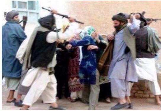
لت و کوب زنان توسط طالبان