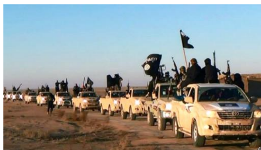
داعش با تصرف موصل مجهز شد

عراق بمائنه مرکز قدرتمند عرب در زمان صدام حسین جنگ خونین و طولانی را با کشور ایران از سر گذرانده بود. صدام همواره ادعای رهبری کشورهای عربی را داشت و خیال اتحاد عرب و پان عربیسم را در سر می پروراند؛ اما کشورهای عربی خلیج خاصه عربستان سعودی هرچند رقیب ایران محسوب می شدند، لیکن از عراق نیرومند می هراسیدند. طرح حمله سران ناتو (به رهبری امریکا و بریتانیا) به عراق در هماهنگی با کشورهای عرب بمیان آمد و رژیم صدام حسین با زور نظامی سرنگون شد. پروژه تبارز و قدرتمند شدن گروه جنایتکار داعش در عراق با همکاری مستقیم عربستان سعودی، ترکیه، کشورهای عرب و سران ناتو به رهبری ایالات متحده امریکا جامعه عمل پوشید و از جانب ستون پنجم مزدور در درون اردو و دولت عراق عملاً حمایت گردید. سقوط شهر بزرگ موصل با نقشه از پیش طراحی شده به کمک مستقیم ستون پنجم و دسیسه خائنانه از درون دولت عراق بمیان آمد. در اثر سقوط شهر کلان موصل بزرگترین منابع مالی و تسلیحاتی به گروه داعش تسلیم داده شد. داعش پس از آن با سلاح سبک و سنگین، خودروهای نظامی فراوان و تجهیزات پیشرفته مجهز گردید. پس از تصرف موصل دامنه تجاوزات داعش به شکل حیرت انگیزی گسترش یافت.