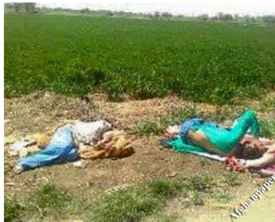
تجاوز به دختران تاجیک در کندوز