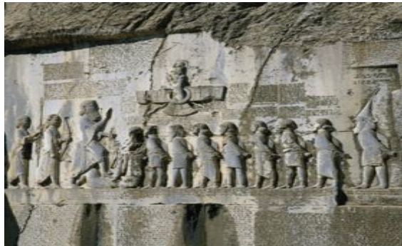
سنگ نبشته بیستون (14)

می‌گوید که سازمان دولتی و سازمان اجتماعی پارس تحت نفوذ شدید نظامات مادها بوده‌است. هووخشتره در کشورش دست به اقدامات عمرانی زد و هم زمان قلمرو خود را در شرق به رود جیحون (15) رساند و به زودی پارس و کرمان را نیز ضمیمه کشورش کرد و سراسر آریانیایی بزرگ را آن چنان که در نقشه سرزمین ماد هویدا است برای اولین بار در تاریخ به زیر یک پرچم آورد. (16)