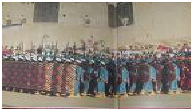
قشون دیاکو بنیانگذار دولت مادهای آریایی (6) (708 تا 655 پ . م .)

دیاکو پس از شکست « سارگن دوم شاه آشور » , فرزند او « فرور تیش » بجای پدر زمام امور را بدست گرفت ودر برابر آشوری ها به پا خاست .